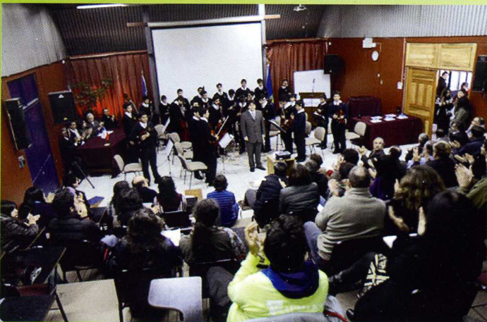
La Orquesta Sinfónica Infantil Nocedal de La Pintana recibe el reconocimiento de los asistentes a la ceremonia