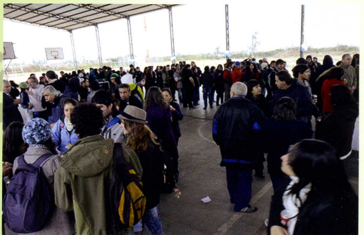
Estudiantes, personal de colaboración y académicos durante la convivencia