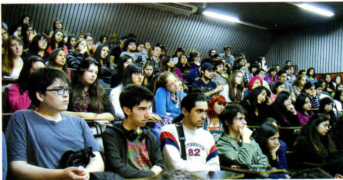
Estudiantes de primer año durante el recibimiento de las autoridades.