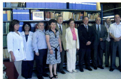
Asistentes a la ceremonia junto a la colección donada.