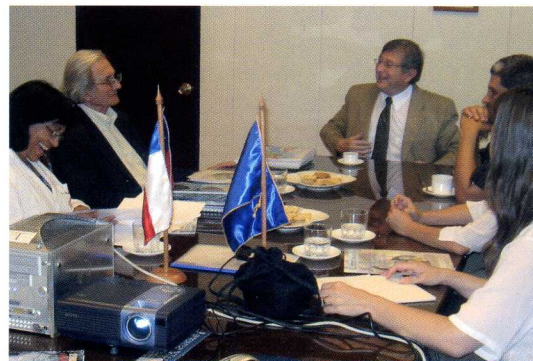
Participantes de la reunión en sala de Consejo de Facultad.

Al término de la visita, se realizó un recorrido por las dependencias de la Facultad y del Mundo Granja, donde pudieron apreciar los módulos y áreas